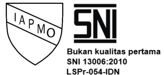
Figure 1. Certification and SPPT SNI first quality and not first quality ceramic tile products

Information: The size of SNI is stated as follows: y = 11x