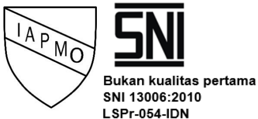
Gambar 1. Tanda sertifikasi dan SPPT SNI kualitas pertama dan bukan kualitas pertama

Keterangan: Besarnya ukuran SNI dinyatakan dengan ketentuan sebagai berikut y = 11x